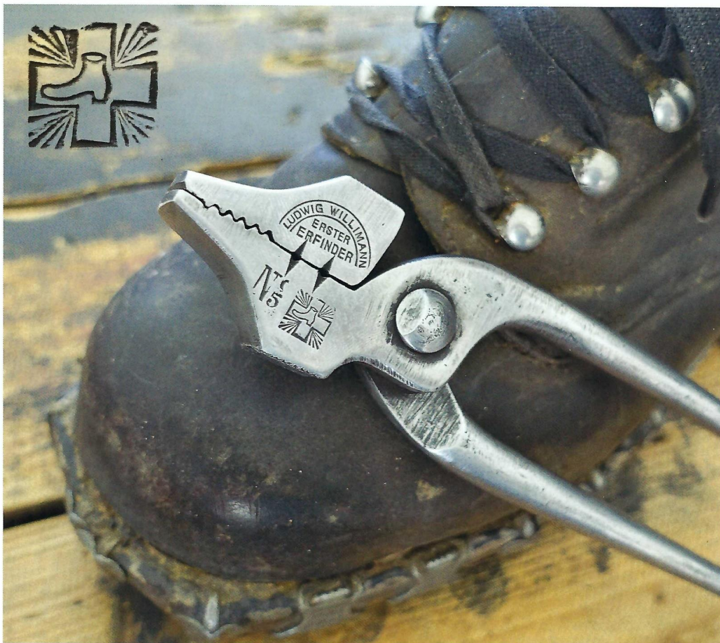
Willimann Schusterfalzzange mit altem Bally Militärschuh im Hintergrund.